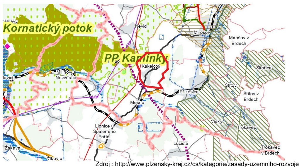
Obrázek 1: Výřez z koordinčního výkresu ZÚR - úplné znění po 4. aktualizaci